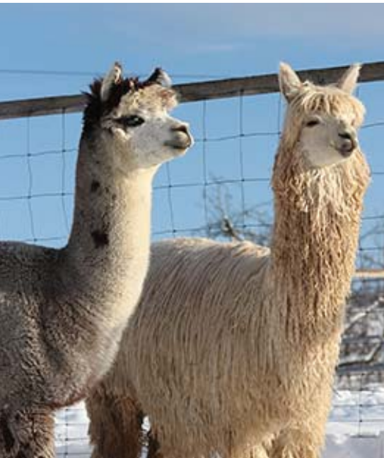
Ein Huacaya und ein Suri Alpaka geniessen den Winter und den Schnee. Un huacaya et un alpaga suri apprécient l'hiver et la neige.

crèche. Vu cette pression parasitaire réduite, un nombre également réduit d'examens s'est avéré nécessaire dans le cadre du programme de surveillance parasitaire, comparé à l'année précédente, où le développement des larves de vers avait été optimal en raison du climat humide et chaud. Quoi qu'il en soit, on rappellera que la météo, que l'on ne peut influencer, peut certes être à l'origine de fluctuations à court terme du nombre de larves de parasites présentes sur les pâturages et ingérées par les animaux. Toutefois, un contrôle à long terme ne peut faire l'impasse sur une gestion des pâtures cohérentes et bien pensée.