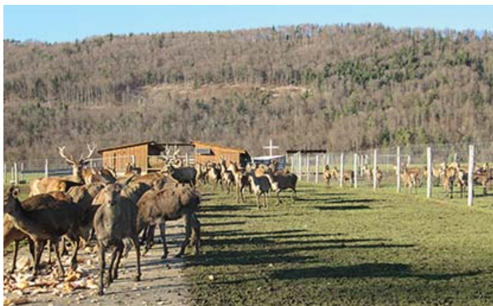
Das Interesse an der Hirschhaltung ist nach wie vor beachtlich: Jedes Jahr entstehen einige schöne Gehege, obschon die Anforderungen bezüglich Ausbildung der Tierhalter gestiegen sind. L'intérêt à la garde de cervidés reste considérable: chaque année apparaissent de beaux nouveaux parcs, malgré le fait que les exigences à la formation des éleveurs se soient accrues.

Les contrôles du piéтин dans le Val-d'Illiez se sont bien passés au printemps. Les troupeaux assainis selon le schéma du SSPR étaient tous indemnes de piéтин. Les éleveurs comme les bergers étaient tout éloges concernant les avantages découlant de l'assainissement de leurs troupeaux en 2013/2014: des animaux en meilleure santé, des gains journaliers plus élevés, moins de pertes, moins de travail (moins de soins aux onglons, pas de pédiluves). Tous s'accordaient pour dire qu'il faut tout faire pour maintenir cette situation. On doit malheureusement constater que les éleveurs de moutons de Suisse romande ne sont pas tous du même avis. Des exposés au cours de berger de même que dans les écoles agricoles, ainsi que des visites d'exploitations ont enrichi le travail et offert