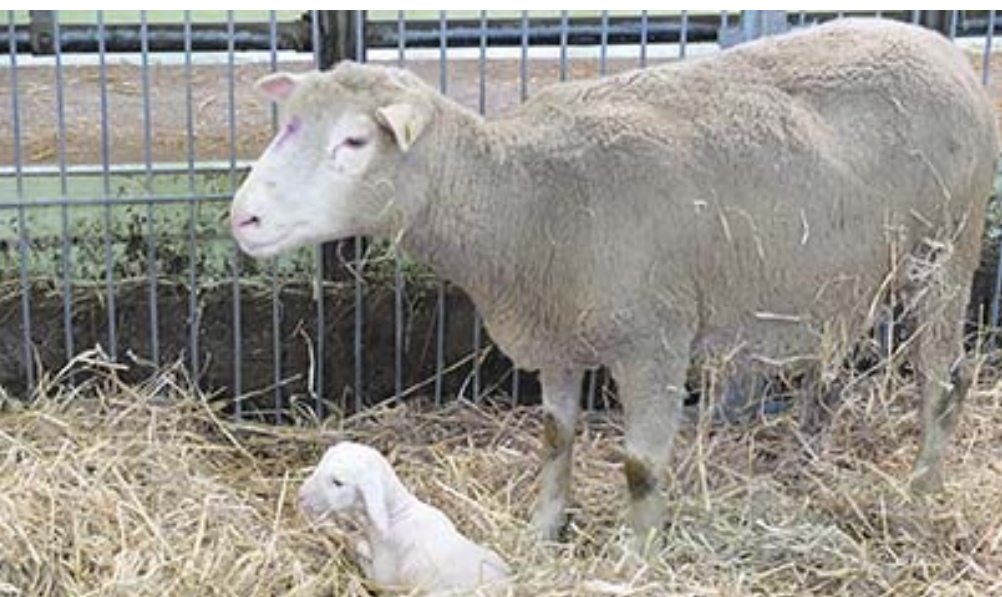
Das Projekt zur Klärung von ökonomischen Auswirkungen von Moderhinke wurde auf der ETH-Forschungsstation Chamau durchgeführt. Le projet de clarification des répercussions économiques du piétin a été mené à la station de recherche Chamau de l'EPFZ.

Im Projekt «Netzwerk Tiergesundheitsdaten Schweiz» war der BGK aktiv und leitete die Arbeiten der Gruppe Kleine Wiederkäuer. Zur Vorbereitung einer möglichen nationalen Moderhinkebekämpfung nahm der BGK an einer ersten Sitzung teil. Die im Rahmen einer Masterarbeit fachlich überarbeiteten Kursunterlagen für den Sachkundenachweis «Gitzli-Enthornung» hat der BGK im Herbst an das BLV zur Anerkennung eingereicht. An der Landwirtschaftsdirektoren-Konferenz im Juni konnte der BGK vorgestellt und dabei auf die Notwendigkeit seiner Tätigkeiten aufmerksam gemacht werden. Es ist auch Aufgabe des BGK, fachliche Anliegen von Tierhaltern und deren Organi-