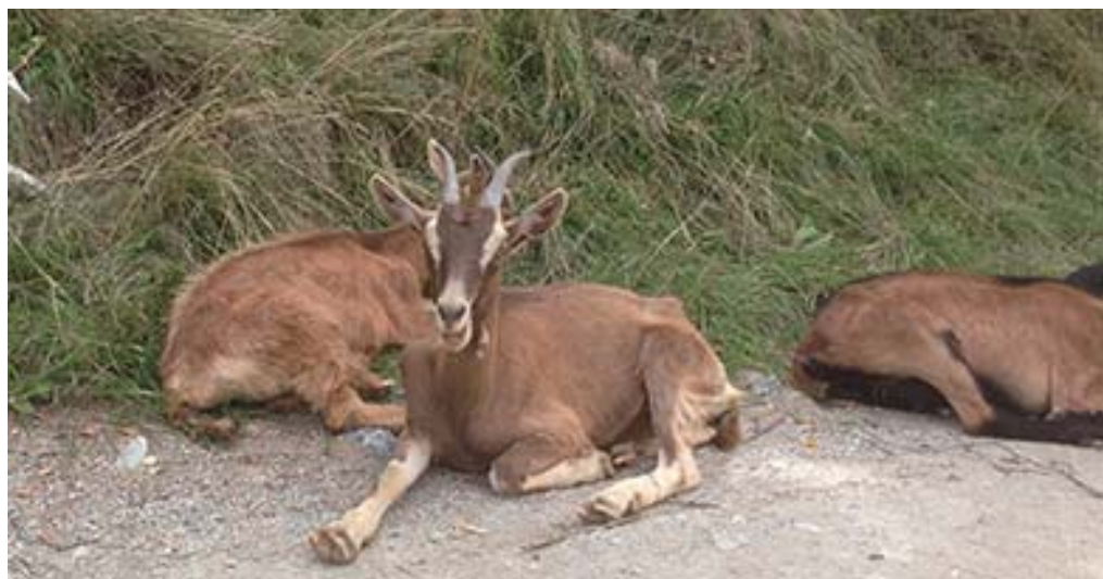
Ziegen von Ossona San Scarl, St-Martin VS, geniessen den Schatten im heissen Sommer 2015. Les chèvres d'Ossona San Scarl, St-Martin (VS), profitent de l'ombre durant la canicule estivale 2015.