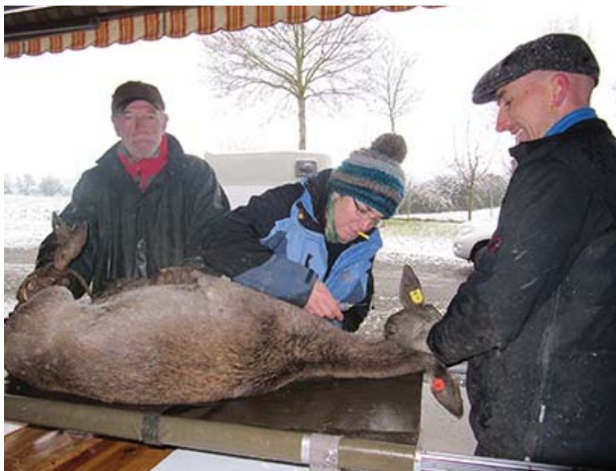
Blutuntersuchungen bei Hirschen sind in der Regel nur bei Importen notwendig. Hier beim Zukauf einer neuen Herde nach einer Bestandessanierung infolge massiver Aborte durch Neospora caninum . Chez les cervidés, seules les importations requièrent généralement des examens sanguins. Ici lors de l'achat d'un nouveau troupeau après un assainissement consécutif à des avortements massifs dus à Neospora caninum .

Im diesem Jahr investierte die Sektion Hirsche einiges an Zeit, um den Betrieben mit massiven Aborten aufgrund von Neospora caninum wieder zu einer gesunden Herde zu verhelfen und das Krankheitsgeschehen zusammen mit der Vetsuisse-Fakultät in Bern aufzuarbeiten. Dazu waren zahlreiche Betriebsbesuche und Blutentnahmen anlässlich von Schlachtungen, aber auch beim Zukauf von neuen Zuchttieren notwendig. Die Ergebnisse sollen im kommenden Jahr publiziert werden. In vielen Hirschgehegen aus der Pionierzeit